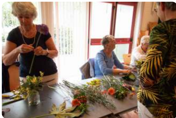
Workshop bloemschikken / Onder: de veilingmeester