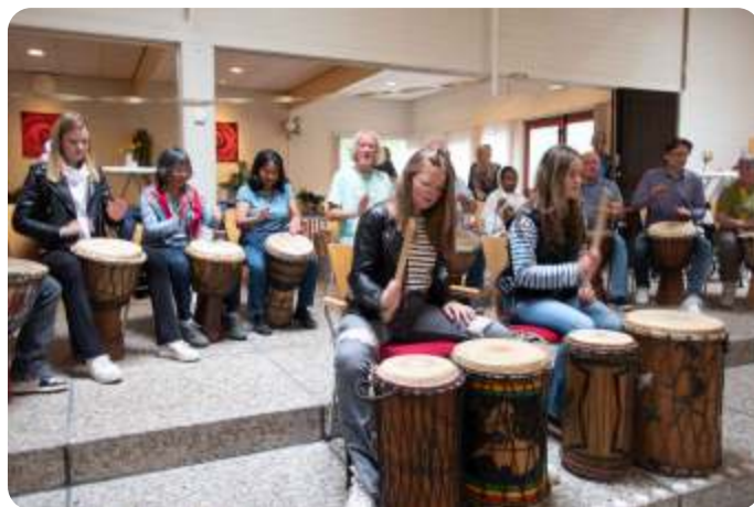
50 jaar Open Hof - workshop djembé